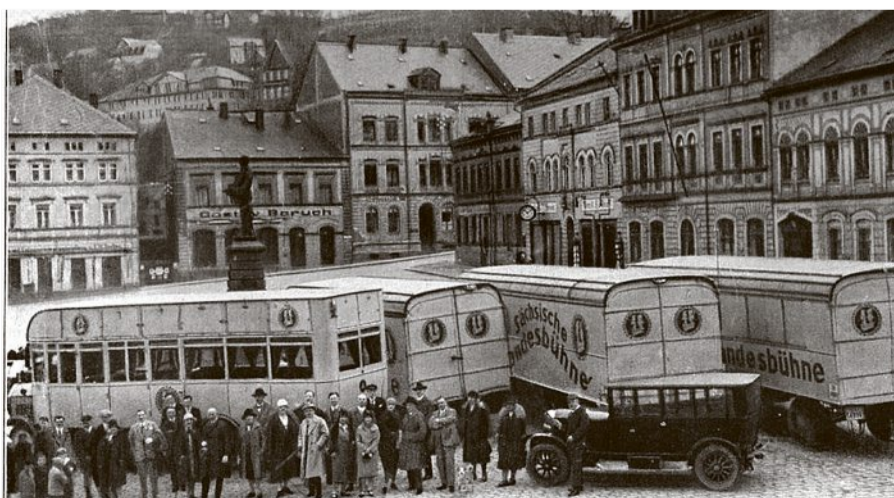
Mit diesen Bussen fuhr das Reisetheater „Sächsische Landesbühne“ damals von Ort zu Ort.

■ Der Theatermann, DDV Edition, 584 Seiten, Preis: 20 Euro, erhältlich im Buchhandel und in den SZ-Treffpunkten.