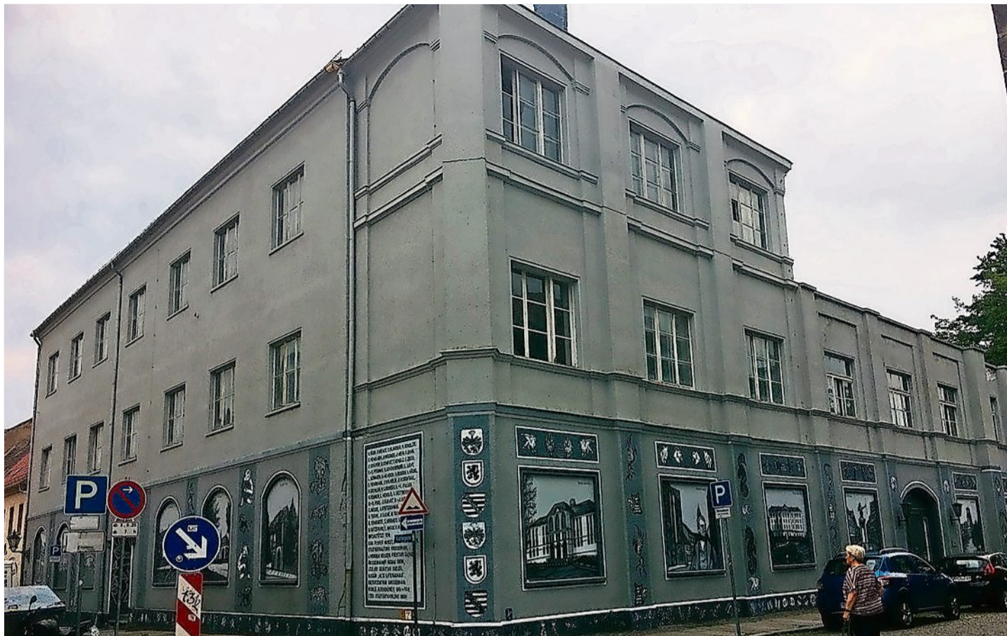
Das Gesellschaftshaus. Hier gingen die Einwohner früher ins Theater. Das Kulturzentrum Krone gab es noch nicht.